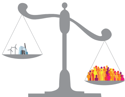
I södra Sverige råder stor obalans mellan behovet och tillgången av el